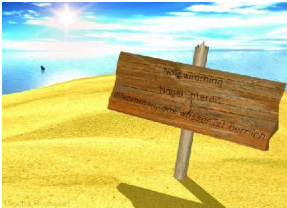
Nederlandse kust: No Swimming Nager Interdit Wilkommen, das wasser ist herrlich